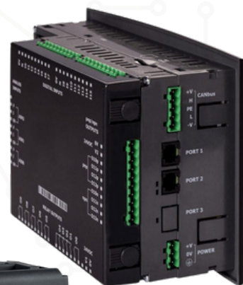
Retro PLC con schermo integrato

Il cloud DIcloud vi permette di portare i vostri sistemi online, quindi raggiungerli da qualsiasi dispositivo e app. Analizzare, visualizzare, scaricare report di un sistema o di più sistemi, direttamente da un'interfaccia web.